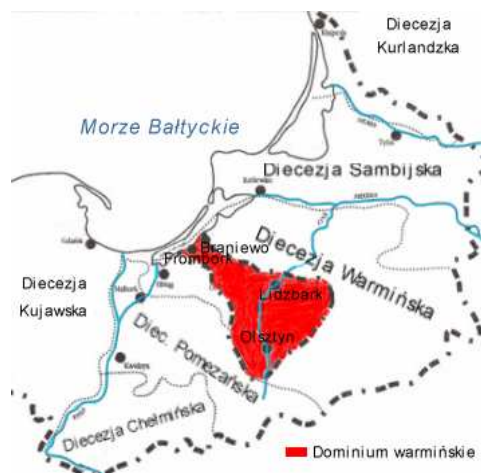
Mapa biskupstwo warmińskie 1243 r.

Okres, gdy Warmia stała się częścią Polski (1466-1772), to lata najświetniejszej historii kulturalnej tych ziem. Wówczas to biskupi warmińscy, udziałni „książęta na Warmii”, do których należeli wybitni przedstawiciele kultury późnego średniowiecza, renesansu, baroku i wreszcie oświecenia, stworzyli ośrodek kultury, który promieniował nie tylko na najbliższe sobie dzielnice, ale na całą Europę. Na lata te przypada też okres świetności Warmii, która stała się w owym czasie prężnym ośrodkiem nauki, kultury i sztuki. Umysłowy wkład Warmii w ogólnoeuropejskie dziedzictwo kulturalne jest o wiele znaczniejszy, niżby wskazywało na to jej niewielkie terytorium.