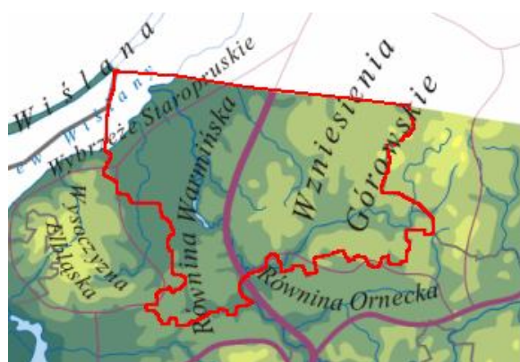
Mapa prezentuje krainy geograficzne na których leży obszar LGD Partnerstwo dla Warmii

Obszar, na którym LGD Partnerstwo dla Warmii zamierza realizować działania w ramach niniejszego LSR leży na północy Polski, w północno zachodniej części Województwa Warmińsko -Mazurskiego, obejmuje obszar powiatu braniewskiego z wyłączeniem miasta Braniewa.. W ramach uwarunkowań geograficznych istotnym pozostaje fakt, że znaczna część obszaru położona jest na terenie Równiny Warmińskiej a pozostała na terenie Wzniesień Górowskich. Charakterystyczną wspólną cechą dla całego terenu jest położenie geograficzne w dorzeczu rzek które swój bieg kończą w Zalewie Wiślanym.