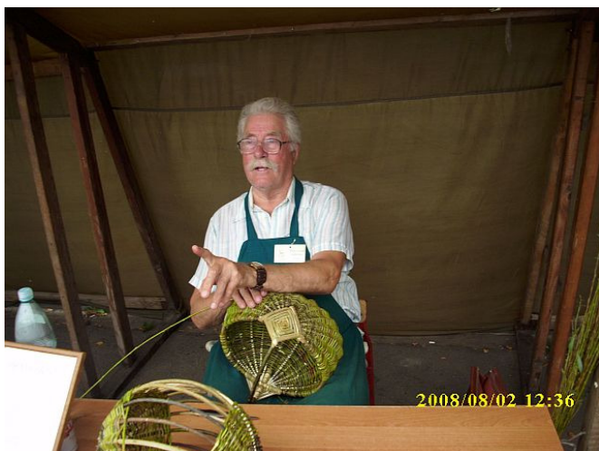
1. Pokaz wykonywania koszy wiklinowych