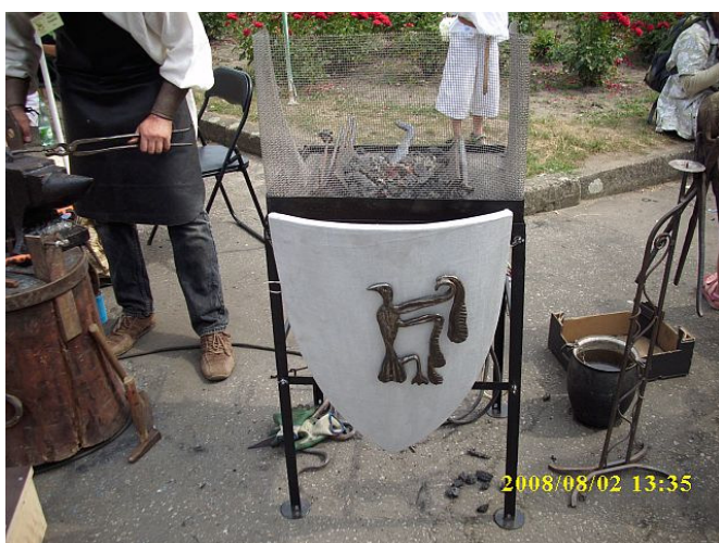
3. Pokaz kowalstwa