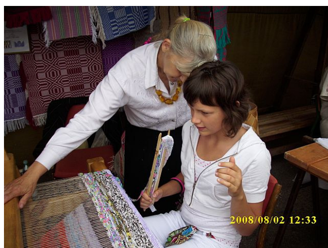
6. Pokaz tkactwa