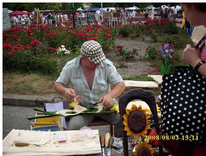
4. Pokaz rzeźbienia w drewnie