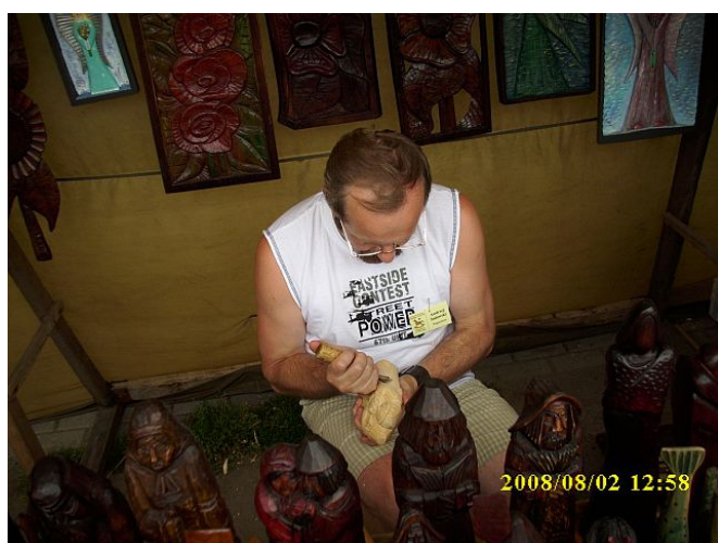
5. Pokaz rzeźbienia