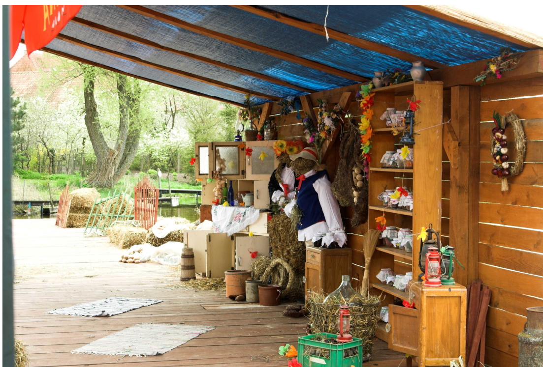
Przeгляд Kapel Ludowych w Rydzewie, gmina Miłki