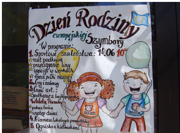
Dzień Rodziny Europejskiej w Szymborach

Finansowane są przedsięwzięcia mające na celu zaktywizowanie środowisk wiejskich do pielęgnowania tradycji oraz zachowania dziedzictwa kulturowego lokalnych środowisk, integrację społeczności wiejskiej, a także wyzwolenie dużego zaangażowania i aktywności do podejmowania nowych inicjatyw na rzecz rozwoju środowiska lokalnego.