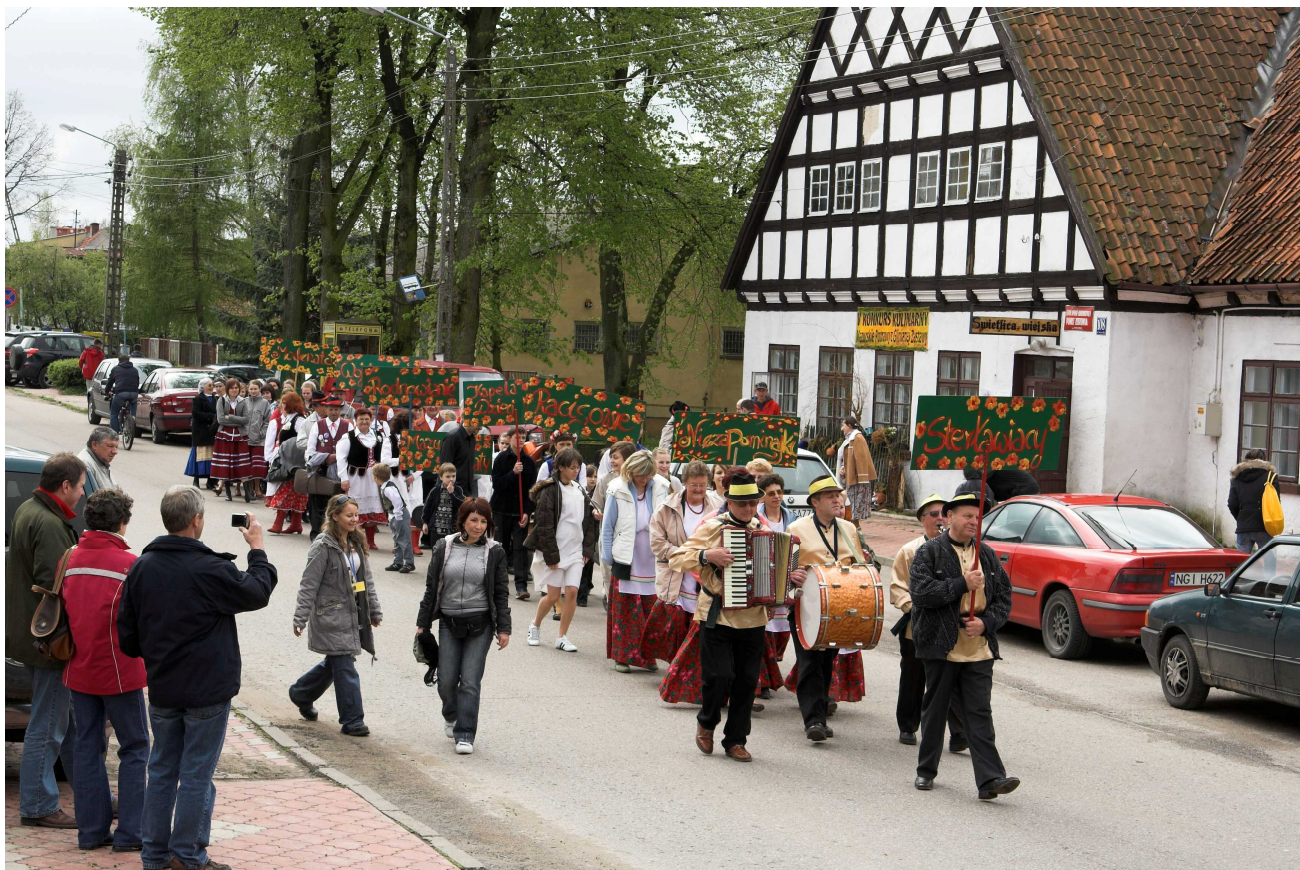
Przełąd Kapel Ludowych w Rydzewie, gmina Miłki

Biuletyn opracowano na podstawie danych: